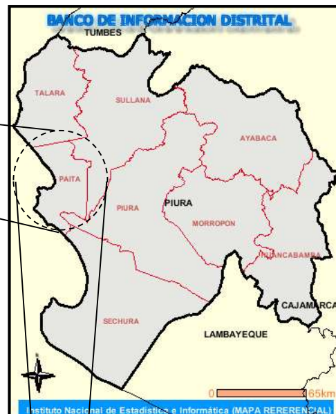
MAPA POLITICO DEL DPTO. DE PIURA