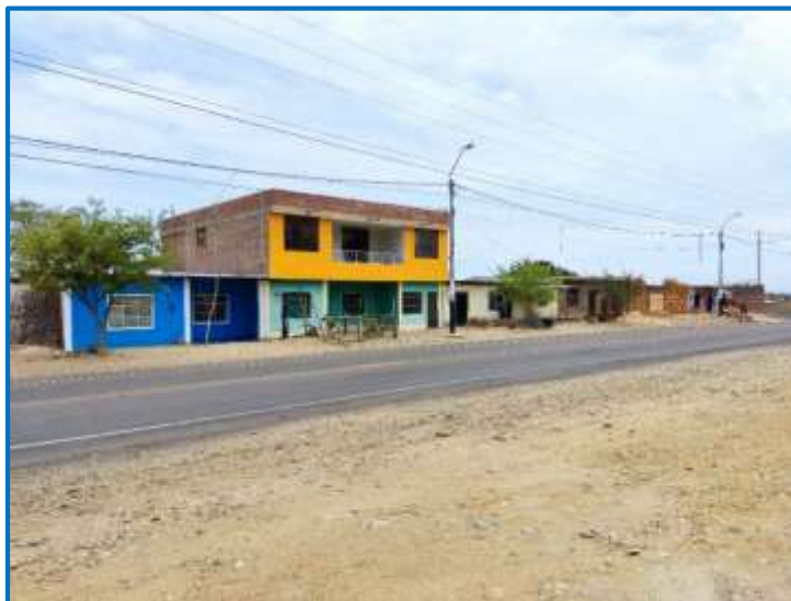
VISTA DEL ESTADO ACTUAL DE LA CALLE PARTE ALTA – MACACARA

Los pobladores de la zona beneficiada con este Proyecto, con el afán de conseguir el proyecto que contribuye a impulsar el desarrollo de su comunidad, es que la Municipalidad Distrital de La Huaca, priorice éste proyecto.