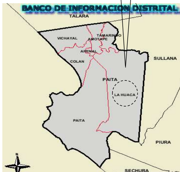
MAPA POLITICO DEL DISTRITO DE LA HUACA