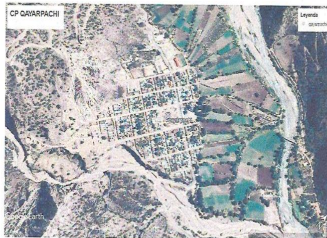
Localización del C.P. Ccayarpachi

continuación, se muestra un resumen de las metas del proyecto: