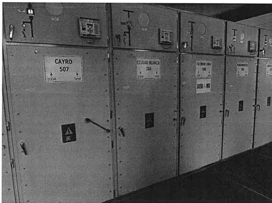
Imagen 1 Celdas 10 kV SET Jesús