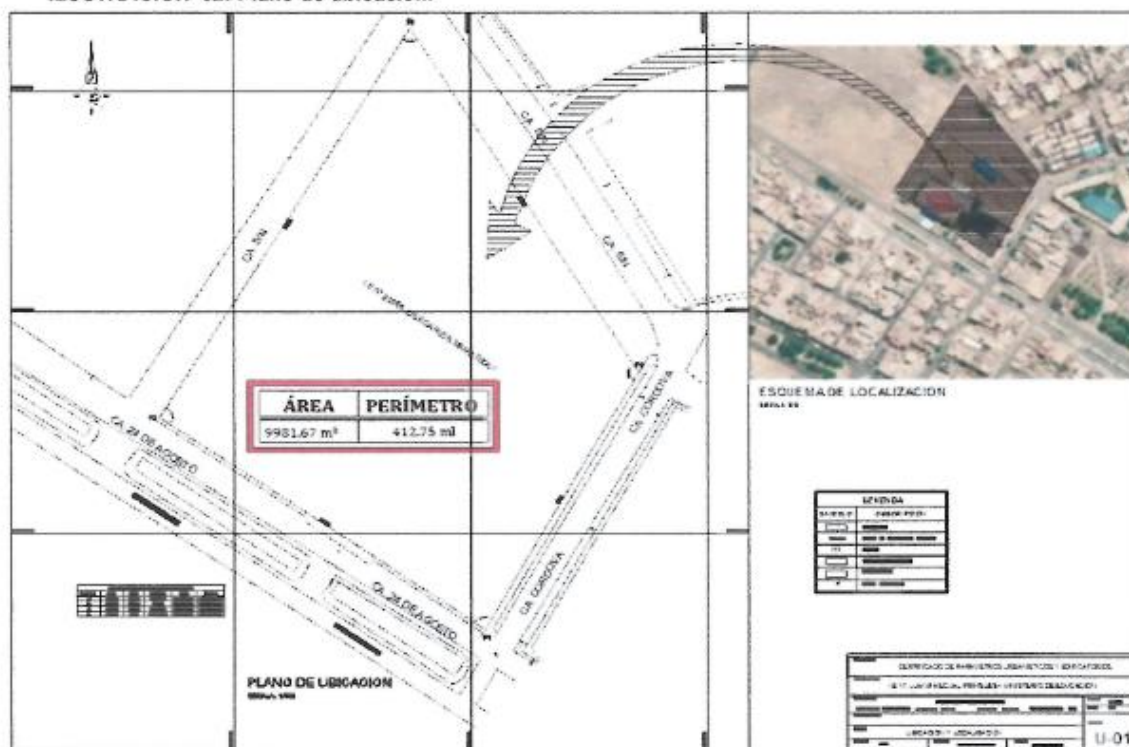
ILUSTRACIÓN°02: Plano de ubicación.