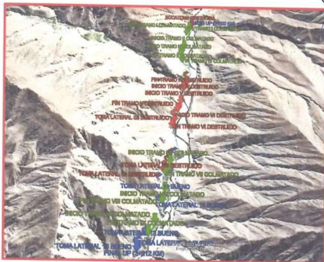
Figura 03: Imagen satelital de la ubicación del proyecto – (Canal Piedra Cruz)