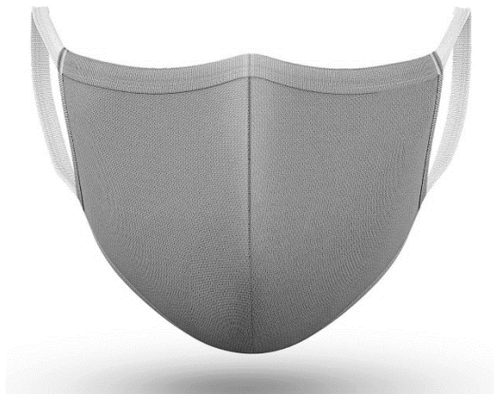
Figura N° 01 – Imagen referencial de Mascarilla para Adultos

Presentación de cada mascarilla (unidad) en bolsa celofán transparente unitaria sellada