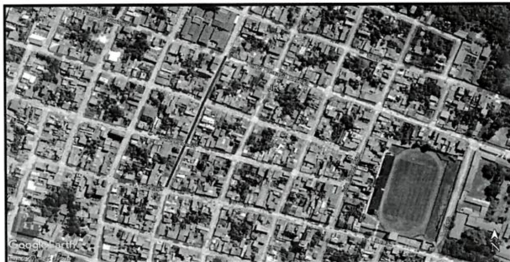
Figura N°01 Ubicación del Proyecto – Jr Coronel secada C-04 a C-06

"RENOVACION DE RED DE ALCANTARILLADO; EN EL(LA) JR. CORONEL SECADA CUADRA 4 AL 6 EN LA LOCALIDAD DE MOYOBAMBA, DISTRITO DE MOYOBAMBA - PROVINCIA DE MOYOBAMBA - DEPARTAMENTO DE SAN MARTIN"