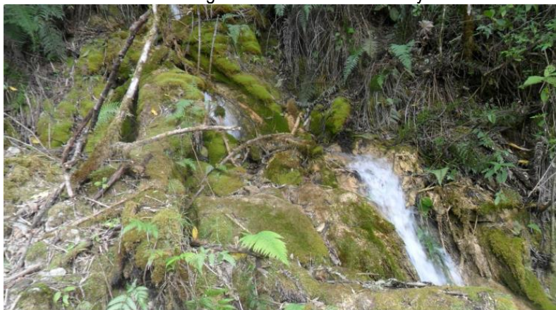
Fuente de agua del manante Pacchihuaycco

Fuente de agua de la quebrada Yacuchuntay: Esta fuente de agua se encuentra en las coordenadas E702061, N8506457 proviene del escurrimiento de aguas subterráneas; donde fue aforado en un lugar estratégico en el mes de agosto y el caudal autorizado es de 10.74 litros/segundo.