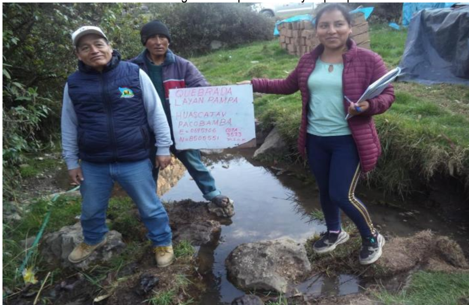
Fuente de agua de la quebrada Layampampa