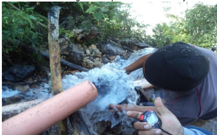
Fuente de agua de la quebrada Yacuchuntay

Fuente de agua de la quebrada Yacuchuntay: Esta fuente de agua se encuentra en las coordenadas E702061, N8506457 proviene del escurrimiento de aguas subterráneas; donde fue aforado en un lugar estratégico en el mes de agosto y el caudal autorizado es de 10.74 litros/segundo.