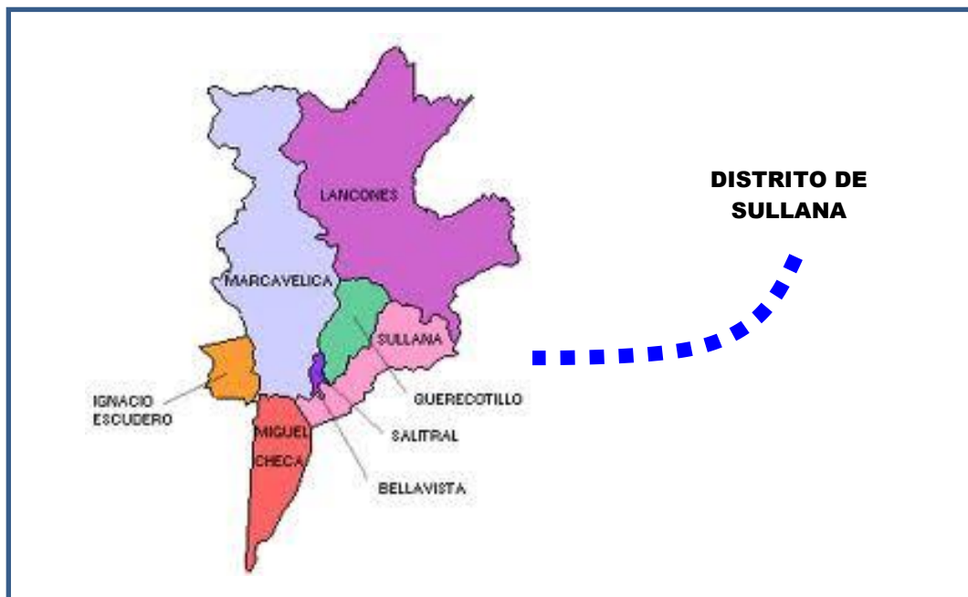
IMAGEN 03: UBICACIÓN GEOGRÁFICA DE LA INSTITUCIÓN EDUCATIVA