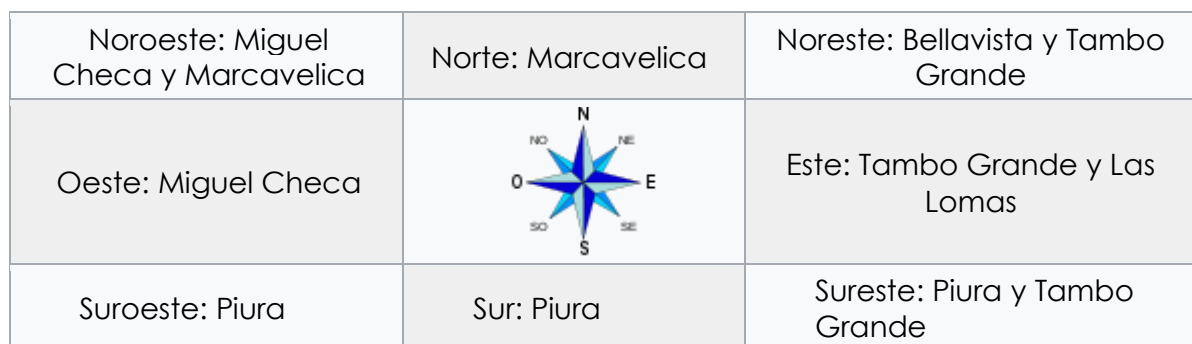
IMAGEN N° 01: MAPA MACRO LOCALIZACIÓN DEL PROYECTO

Por el Norte : Con el Distrito de Marcavelica. Por el Este : Con los Distritos de Tambogrande y Las lomas. Por el Sur : Con la Provincia de Piura. Por el Oeste : Con el Distrito de Miguel Checa.