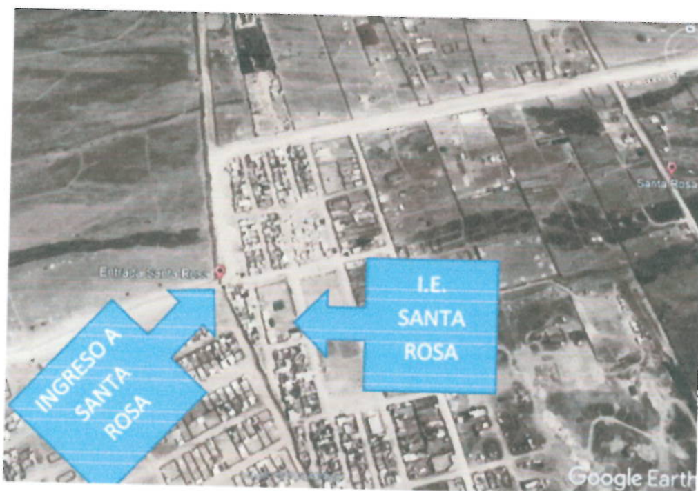
Figura N° 01

Los rasgos geomorfológicos predominantes en el área de estudio corresponden al flanco occidental andino, que se caracteriza por una morfología abrupta el relieve es costa y empieza la zona de yunga y refleja una intensa actividad erosiva fluvial.