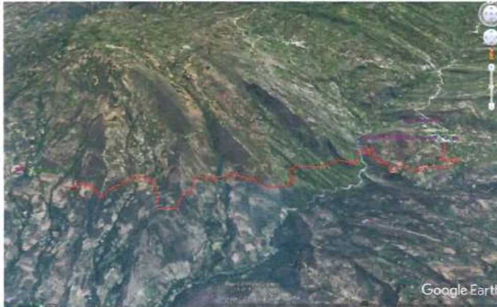
Gráfico N° 03: Ubicación del área de estudio del Camino Vecinal.