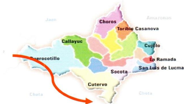
Mapa 4. Ubicación geográfica del Proyecto.