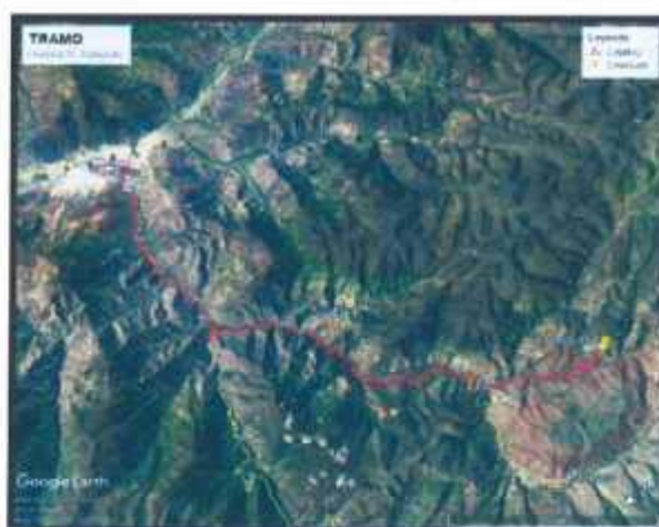
GRÁFICO N° 01: Acceso a la localidad

El acceso desde la ciudad de Huánuco, en dirección Nor-Oeste, es por medio de la carretera asfaltada que se dirige hacia el distrito de Yurumayo pasando por el puente Higuera y el puente Punyac hasta el centro poblado de Huancapallac. Este trayecto se realiza en un tiempo aproximado de 30 min. Luego nos dirigimos en la dirección Sur-Oeste tomando la carretera de camino afirmado, este llega a los distritos de Chaulán y de Margos, luego de transcurrido una hora y media desde Huánuco llegamos al desvío cercano al centro poblado de Yarumayo; proseguimos en dirección Sur-Oeste ya sea con camioneta o con carro particular el camino es de trocha o camino vecinal, es este camino paralelo al río Milpo, que luego de transcurrido aproximadamente dos horas desde el centro de Huánuco que se llega a la capital del Distrito de San Pedro de Chaulán.