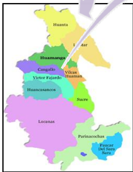
MAPA N° 1. 1 DE UBICACIÓN NACIONAL – DEPARTAMENTAL – PROVINCIAL – DISTRITAL