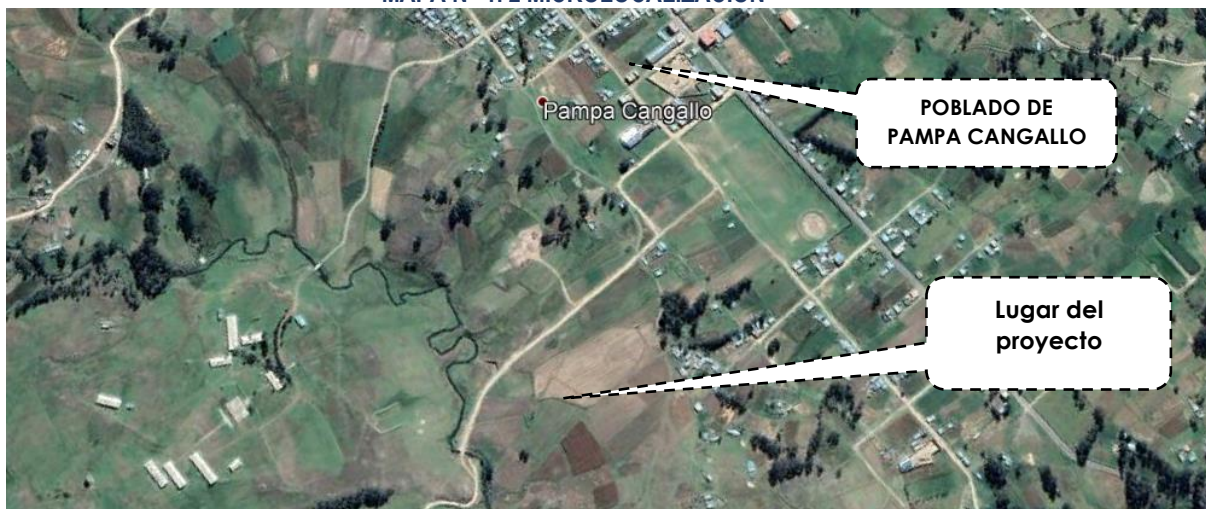
MAPA N° 1. 2 MICROLOCALIZACION