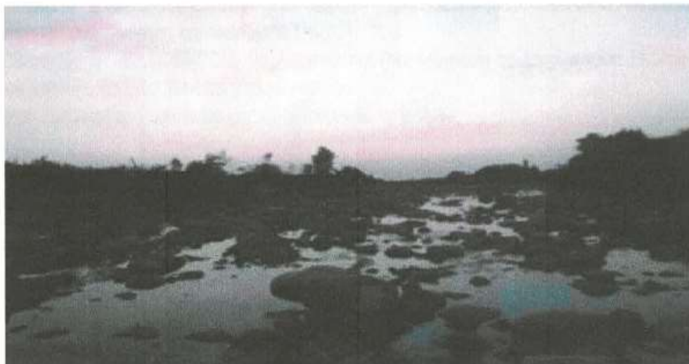
Imagen N° 02: Vista del Rio Moche, aguas abajo; a la altura donde se proyecta la Bocatoma Santo Domingo, se visualiza la cantidad de material canto rodado existente en el lecho del rio y las aguas que se derivan a al canal de tierra Santo Domingo.

Al verse limitados los agricultores a cultivar a duras penas en pequeñas campañas o muchas veces no hacerla genera que exista pocos niveles de producción agrícola.