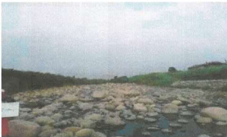
Imagen N° 01: Vista del Río Moche, aguas arriba; a la altura donde se proyecta la Bocatoma del Canal Santo Domingo, al fondo se visualiza la cantidad de material canto rodado existente en el lecho del río y la derivación del Canal Santo Domingo.