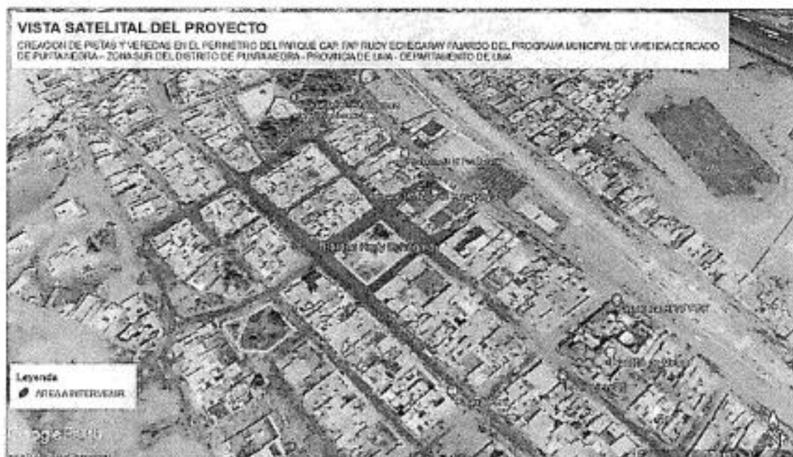
Figura N° 2: Vista satelital del proyecto