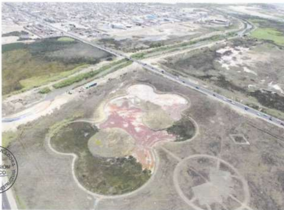
Imagen aérea de área de intervención