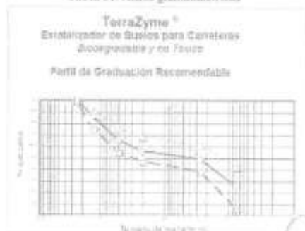
Tabla 01. Horno granulométrico

[Signature] ING. ESTE. - CIP Nº 44996 COORDINADOR - REC. 213399