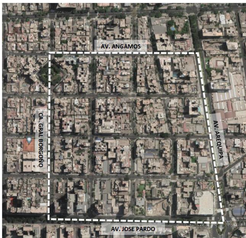
Imagen N° 02 : área de la zona de intervención