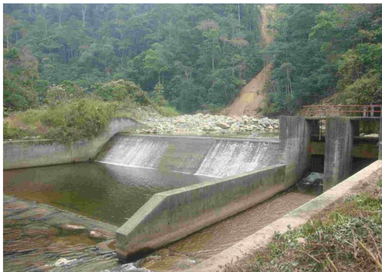
FOTOGRAFÍA 2. Represa Llaylla.