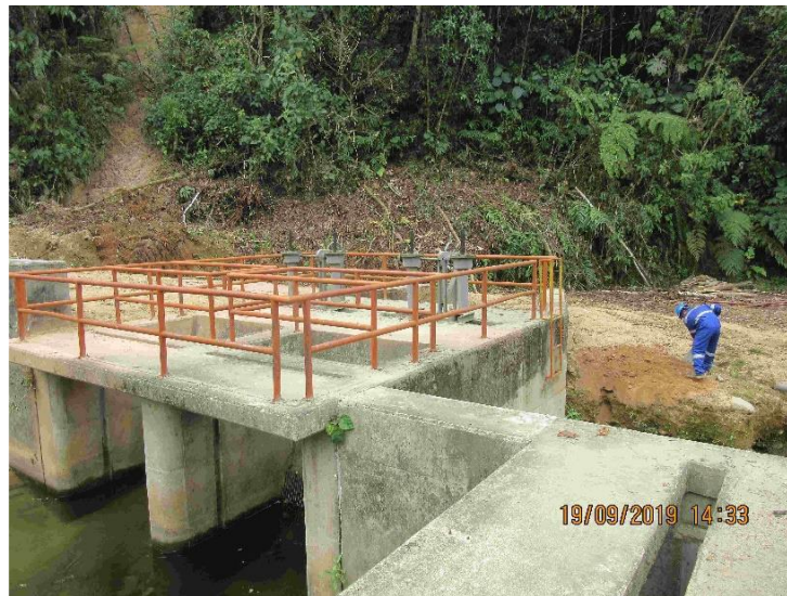
FOTOGRAFÍA 5. Barandas a ser reemplazados y reubicados.