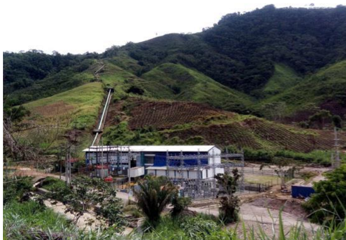
FOTOGRAFÍA 1. Central hidroeléctrica Chalhuamayo.

A continuación, se presenta las vistas fotográficas de la hidroeléctrica Chalhuamayo y de la Represa Llaylla.