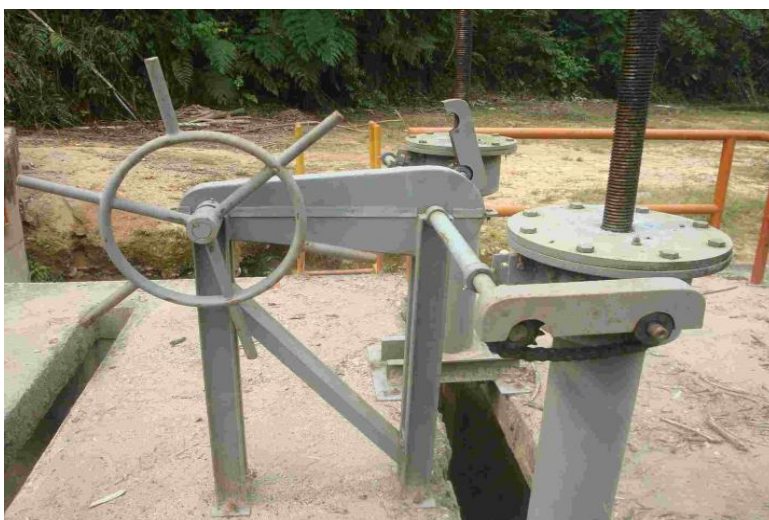
FOTOGRAFÍA 3. Mecanismo de izaje y tornillo con mando manual