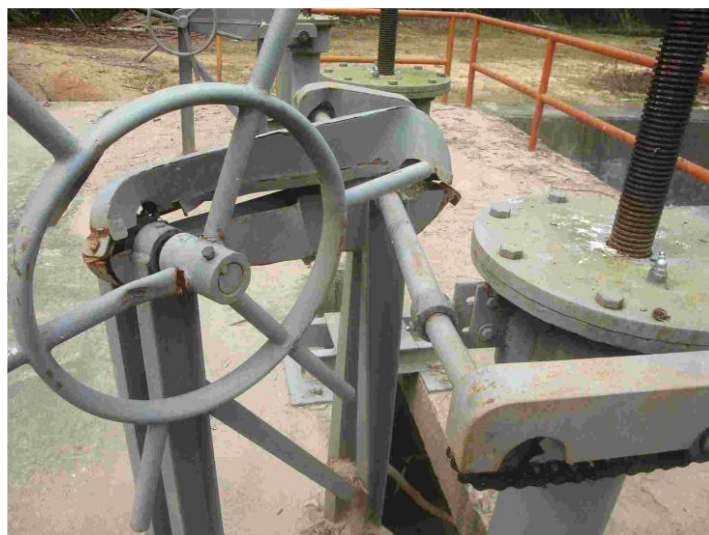
FOTOGRAFÍA 4. Mecanismo de izaje y tornillo Averiado.