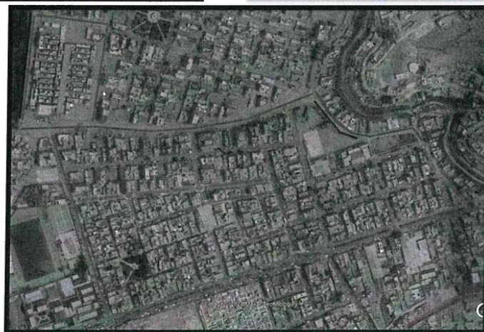
En la imagen se muestra Asociación Alameda Baja en vista de planta. Línea Roja - Mejoramiento De La Transitabilidad Vehicular Y Peatonal.