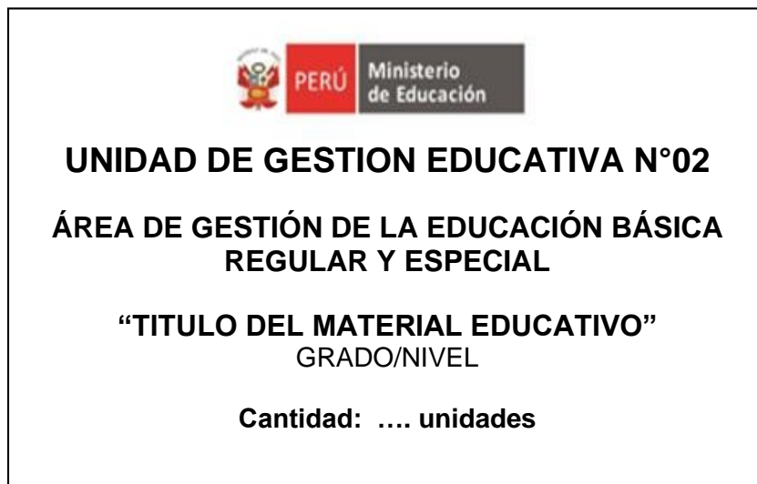
Figura N° 01 (referencial)