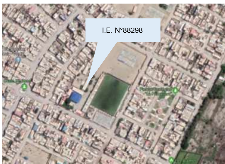
Grafico N° 01: Provincia de Santa, Distrito de Nuevo Chimbote, H.U.P. David Dasso Hock, Mz-E, Lt-01, Etapa II

Región : Ancash Departamento : Ancash Provincia : Santa Distrito : Nuevo Chimbote