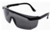
LENTES DE SEGURIDAD