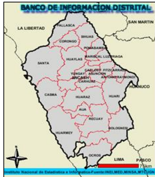
DPT. DE ANCASH