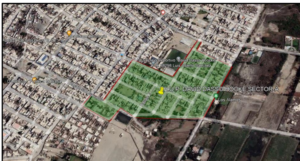
Micro Localización (Distrito Nuevo Chimbote – H.U.P. DAVID DASSO HOOKE SECTOR - A