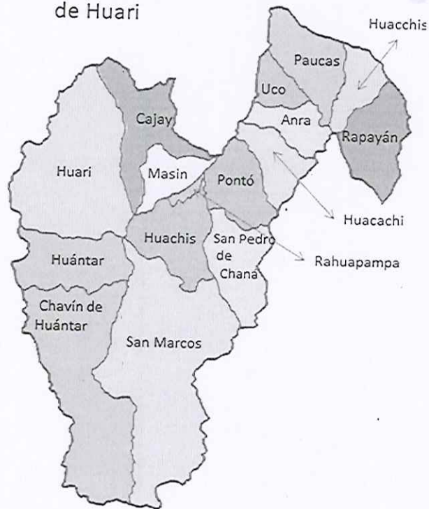
GRÁFICO N° 02