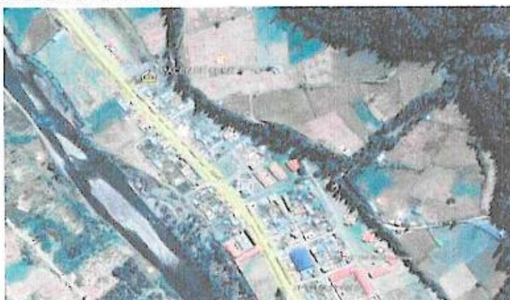
Imagen: Ubicación de la Obra.

La prestación de servicios se dará en la obra: "MEJORAMIENTO DE LA TRANSITABILIDAD VEHICULAR DE LA CARRETERA PAUCARTAMBO – ABRA ACJANACU, EN LOS TRAMOS: PAUCARTAMBO (DESVÍO CU-113) – LLAYCHU – KAPACHI (EMP CU – 989), KAPACHI (EMP CU – 989) – SUNCHUBAMBA – JAJAHUANA – CHALLABAMBA- DESVIO CU990, EMP. CU- 989 (CHALLABAMBA) – EMP CU- 113 (ABRA ACJANACU), EN LOS DISTRITOS DE PAUCARTAMBO Y CHALLABAMBA DE LA PROVINCIA DE PAUCARTAMBO - DEPARTAMENTO DE CUSCO".