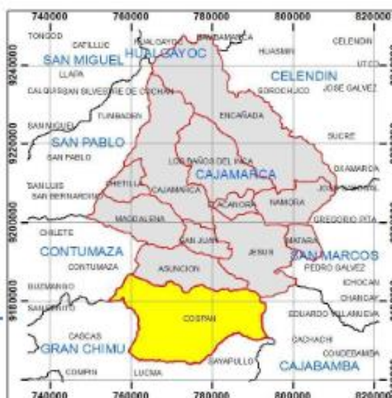
Gráfico 03: Mapa político de la provincia de Cajamarca indicando el distrito de Cospán.