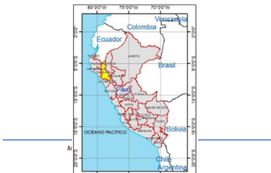
Gráfico 01: Mapa Político de Perú indicando el departamento de Cajamarca