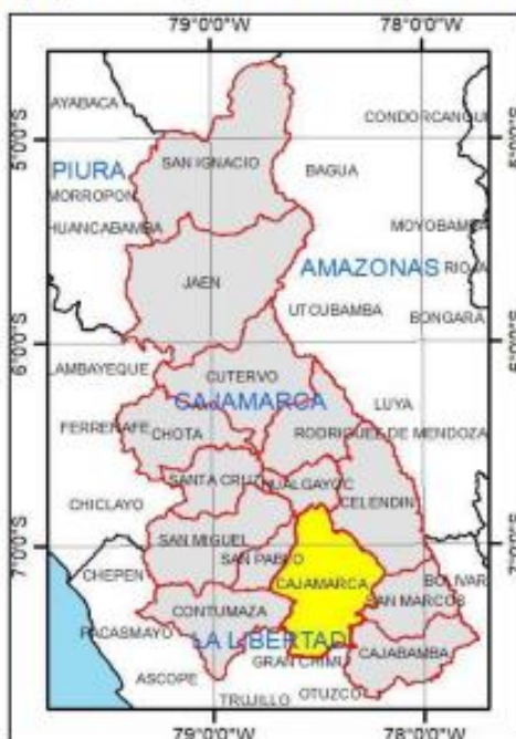
Gráfico 02: Mapa político de Cajamarca indicando la provincia de Cajamarca.