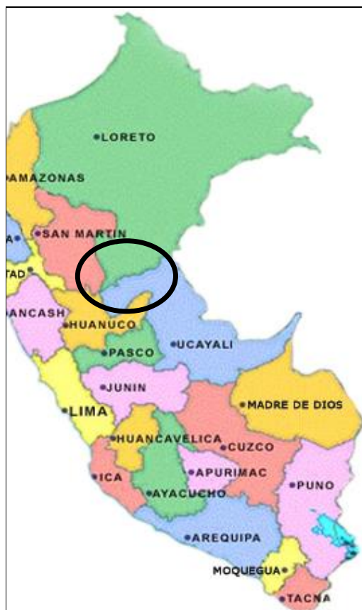
Mapa N° 01: Mapa del Perú