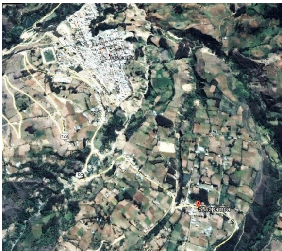
Mapa Satelital N° 05: Desde tayabamba hasta Buenos Aires