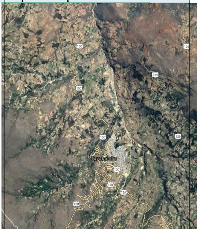
Mapa Satelital N° 04: Distrito Tayabamba