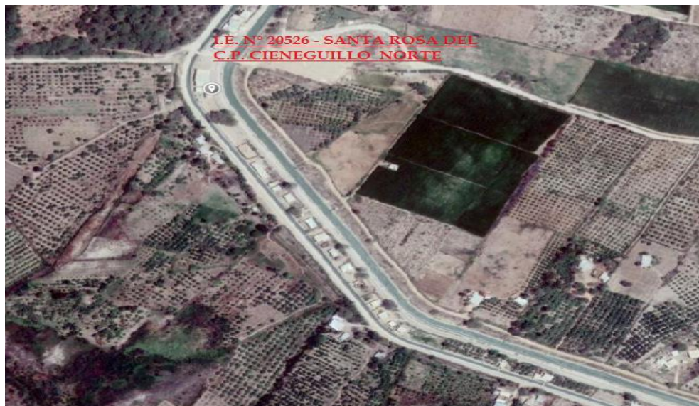
Ubicación Geográfica de la Institución Educativa