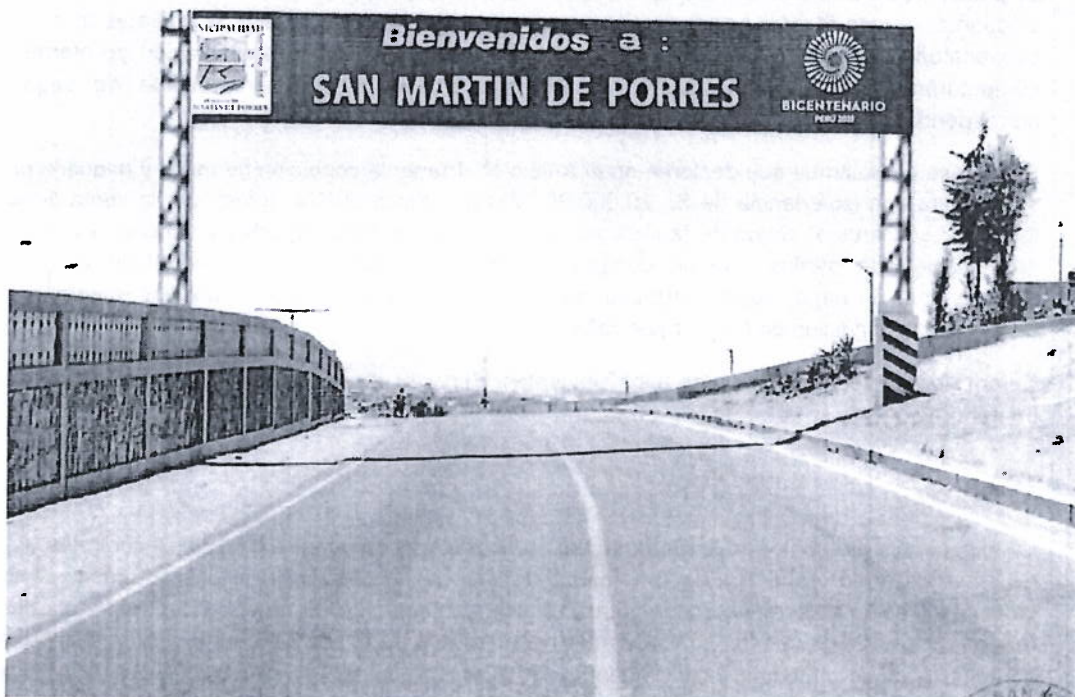
DISEÑO DE REFERENCIA, (DISEÑO OFICIAL EN OFIC. DE COMUNICACIÓN)