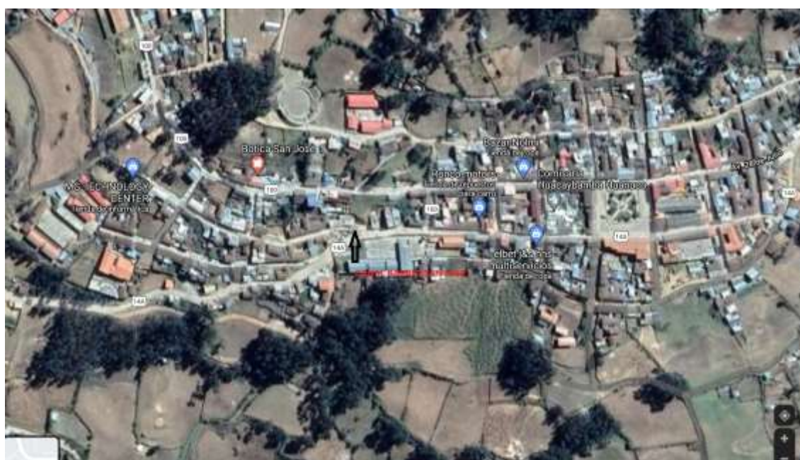
Figura N° 04: Ubicación del presente proyecto.