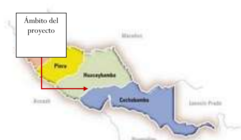
Figura N°02: Mapa de la Provincia de Huacaybamba y sus Distritos.