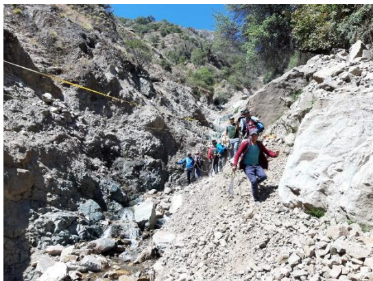
Fotografía N° 02: Red de conducción existente