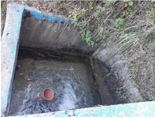
Fotografía N° 03: Vista de cámara rompe presión