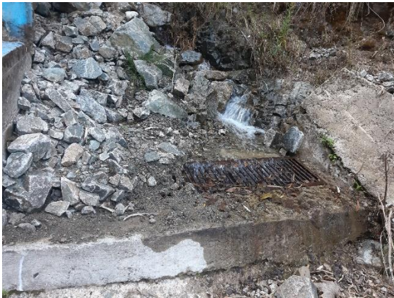
Fotografía N° 04: Infraestructura de almacenamiento