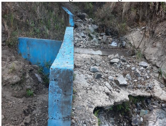
Fotografía N° 01: Vista de la captación existente.

A continuación, se muestra algunas vistas fotográficas de la infraestructura existente: