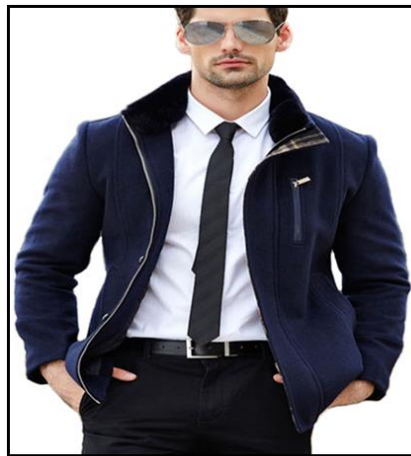
La imagen es referencial Ítem requiere ficha técnica y certificado de pruebas