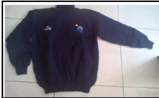
La imagen es referencial

Ítem requiere ficha técnica y certificado de pruebas