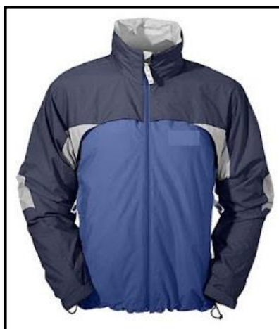
La imagen es referencial Ítem requiere ficha técnica y certificado de pruebas