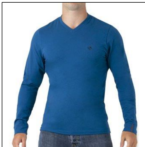
La imagen es referencial

Ítem requiere ficha técnica y certificado de pruebas