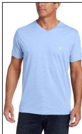
La imagen es referencial Ítem requiere ficha técnica y certificado de pruebas