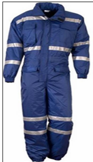
La imagen es referencial

Ítem requiere ficha técnica y certificado de pruebas