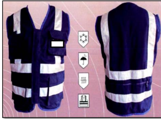
La imagen es referencial Ítem requiere ficha técnica y certificado de pruebas