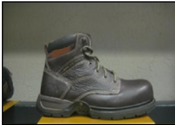
La imagen es referencial Ítem requiere ficha técnica

El ítem requiere presentación de la muestra la cual será enviada en cualquier talla cumpliendo las características indicadas o ficha técnica que precise las características requeridas.