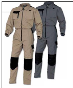
La imagen es referencial Ítem requiere ficha técnica y certificado de pruebas