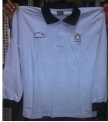
La imagen es referencial Ítem requiere ficha técnica y certificado de pruebas