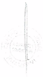
Imagen referencial del cubrecama de una plaza y media