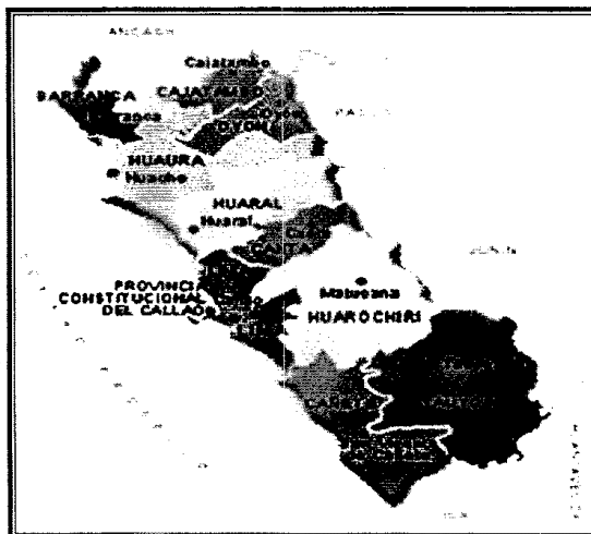
GRÁFICO °01. Macro localización del Proyecto