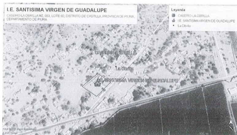
Ubicación Geográfica de la I.E. Santísima Virgen de Guadalupe

MUNICIPALIDAD DISTRITAL DE CASTILLA GERENCIA DE DESARROLLO URBANO RURAL SUB GERENCIA DE INFRAESTRUCTURA