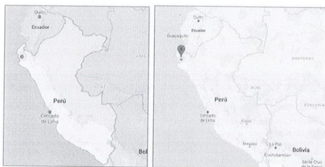
UBICACIÓN DEL DEPARTAMENTO DE PIURA EN EL PERÚ

Latitud : -4.9848 Longitud : -80.5749 Altitud : 56 m.s.n.m.