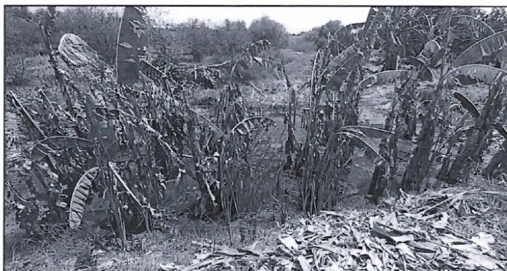
Imagen: Plantaciones deterioradas producto de suelos saturados y salinos.