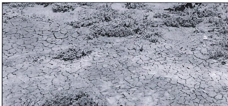
Imagen: Presencia de salinidad en terreno agrícola.