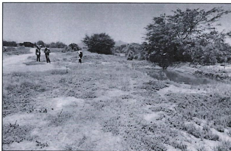
Imagen: Vista de grama salada y nivel freático superficial.