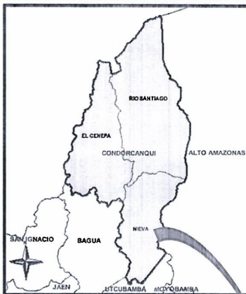
GRAFICO N° 03 LOCALIZACIÓN GEOGRÁFICA DEL CENTRO POBLADO JUAN VELASCO ALVARADO