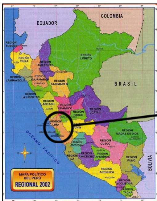
Mapa político del Perú