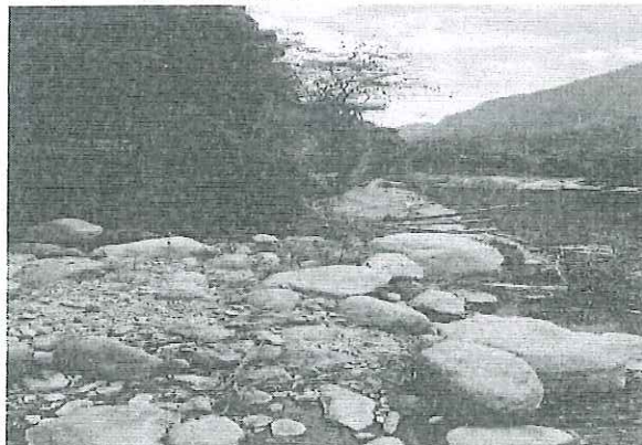
Imagen 01: LUGAR DE CONSTRUCCIÓN DEL PUENTE

Departamento : PIURA Provincia : HUANCABAMBA Distrito : HUARMACA Caserío : CHALPA NORTE : 9365374 ESTE : 651473 Altitud : 1625.10 m.s.n.m.