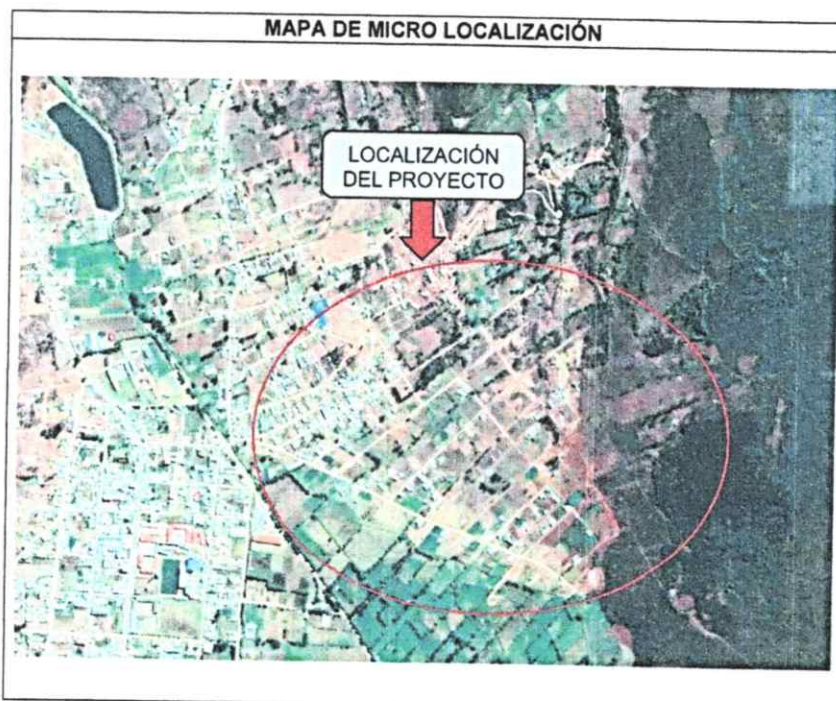
Gráfico N° 03 – Mapa de micro localización del proyecto

*SERVICIO PARA LA EJECUCIÓN DEL MANTENIMIENTO DE CALLES DEL BARRIO SHUITUTE DEL DISTRITO DE CELENDÍN, PROVINCIA DE CELENDÍN, DEPARTAMENTO DE CAJAMARCA*