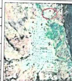
Gráfico N° 01 – Datos, coordenadas y ubicación del proyecto.

"SERVICIO PARA LA EJECUCIÓN DEL MANTENIMIENTO DE CALLES DEL BARRIO SHUITUTE DEL DISTRITO DE CELENDÍN, PROVINCIA DE CELENDÍN, DEPARTAMENTO DE CAJAMARCA"