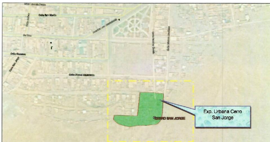
UBICACIÓN LOCAL: EXP. URBANA CERRO SAN JORGE DEL DISTRITO DE VEGUETA