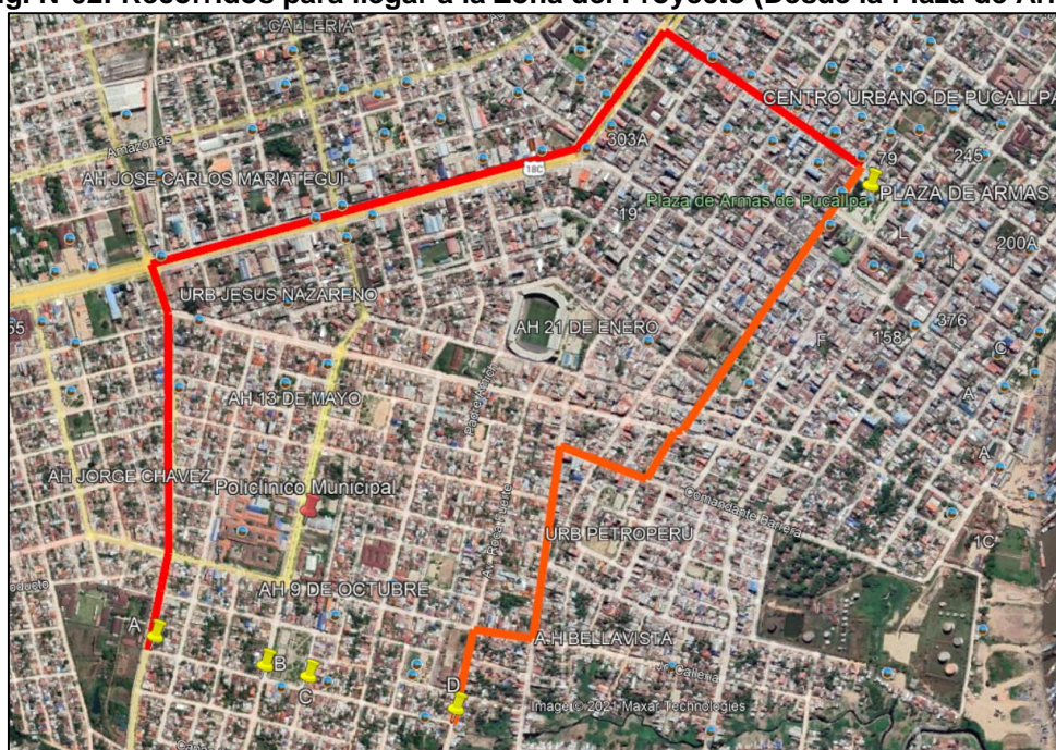
Fig. N°02: Recorridos para llegar a la Zona del Proyecto (Desde la Plaza de Armas)

La zona de estudio se encuentra a 149 msnm.