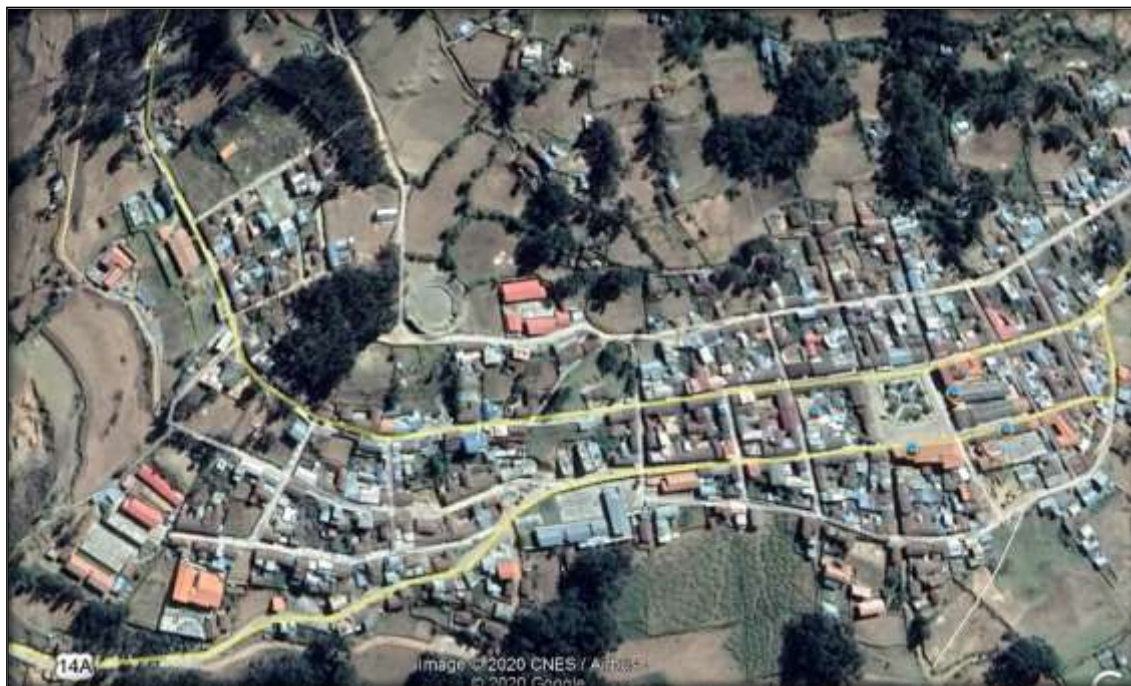
Figura N° 03: Mapa de Localización de la provincia de Huacaybamba.