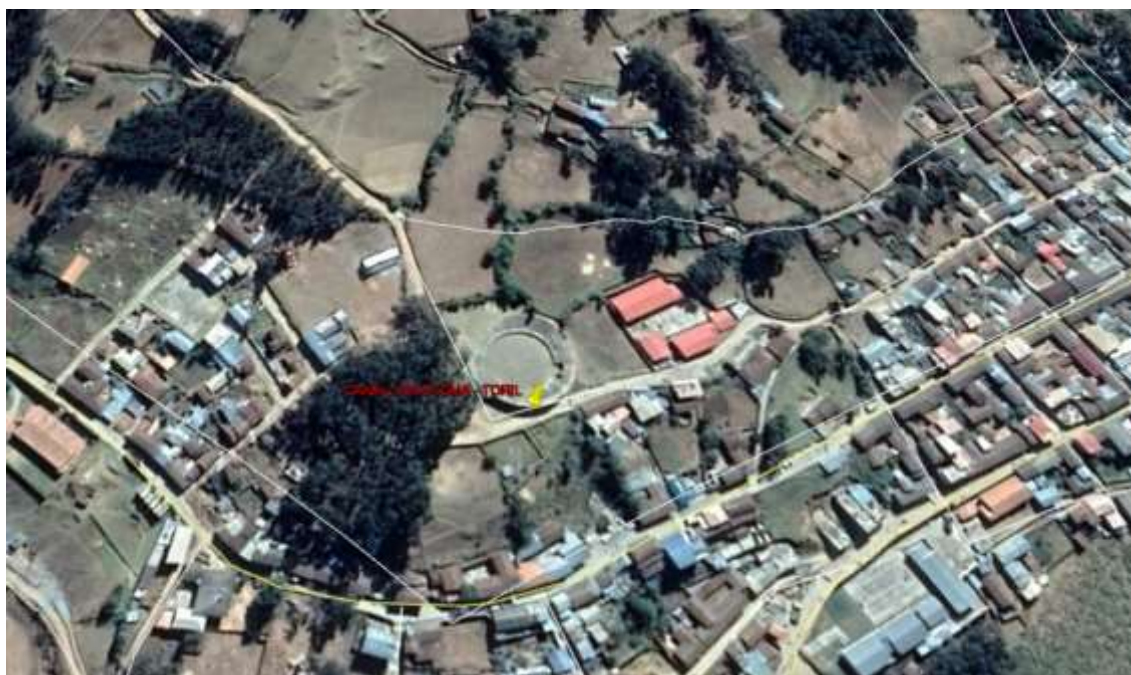
Figura N° 04: Ubicación del presente proyecto.