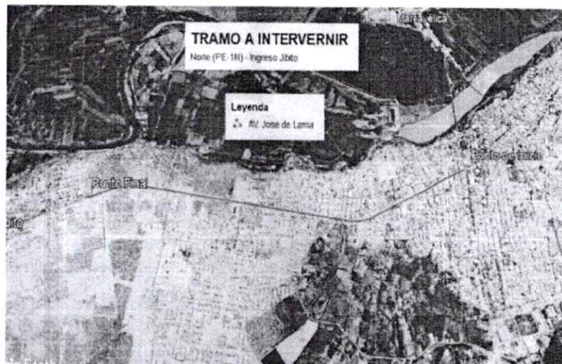
ZONA DE INFLUENCIA DEL PROYECTO

"Año del Fortalecimiento de la Soberanía Nacional"