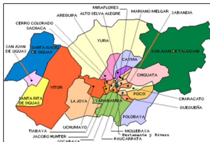
Imagen 01.- Provincia de Arequipa

"MEJORAMIENTO DEL SERVICIO RECREATIVO DEL PARQUE SANTA ROSA, UPIS PAISAJISTA DEL DISTRITO DE JACOBO HUNTER - PROVINCIA DE AREQUIPA - DEPARTAMENTO DE AREQUIPA" CON CUI N° 2435852