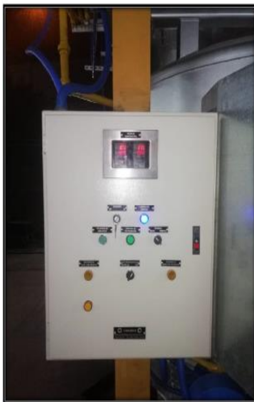
TABLERO DE CONTROL