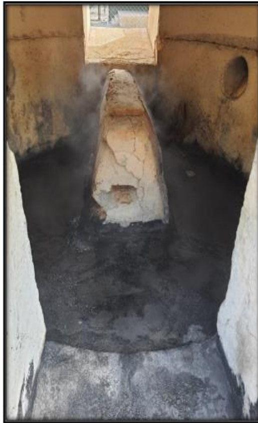
INTERIOR DE LA CAMARA PRIMARIA