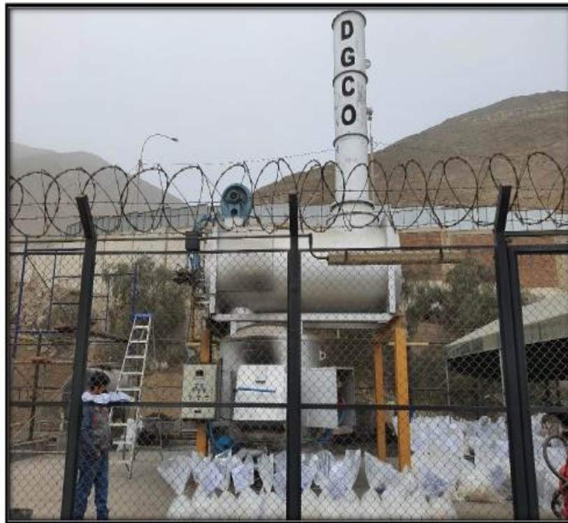
INCINERADOR DE DROGAS