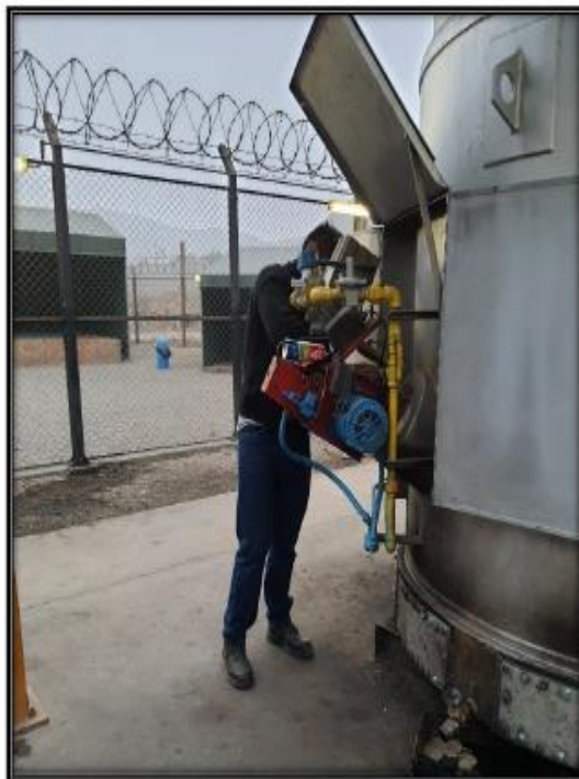
UNO DE LOS DOS QUEMADORES DE LA CAMARA PRIMARIA