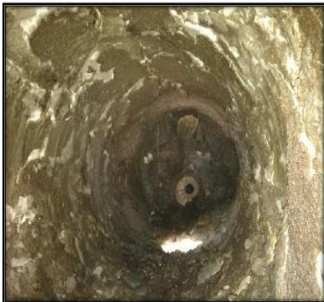
INTERIOR DE LA CAMARA SECUNDARIA