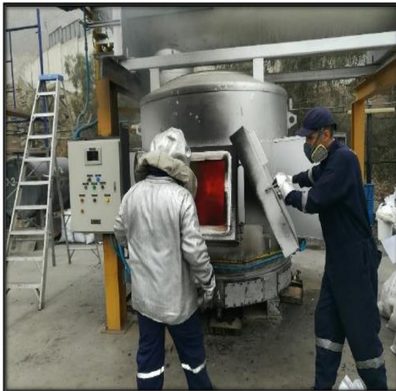
TABLERO DE CONTROL Y COMPUERTA DE INGRESO DE CARGA