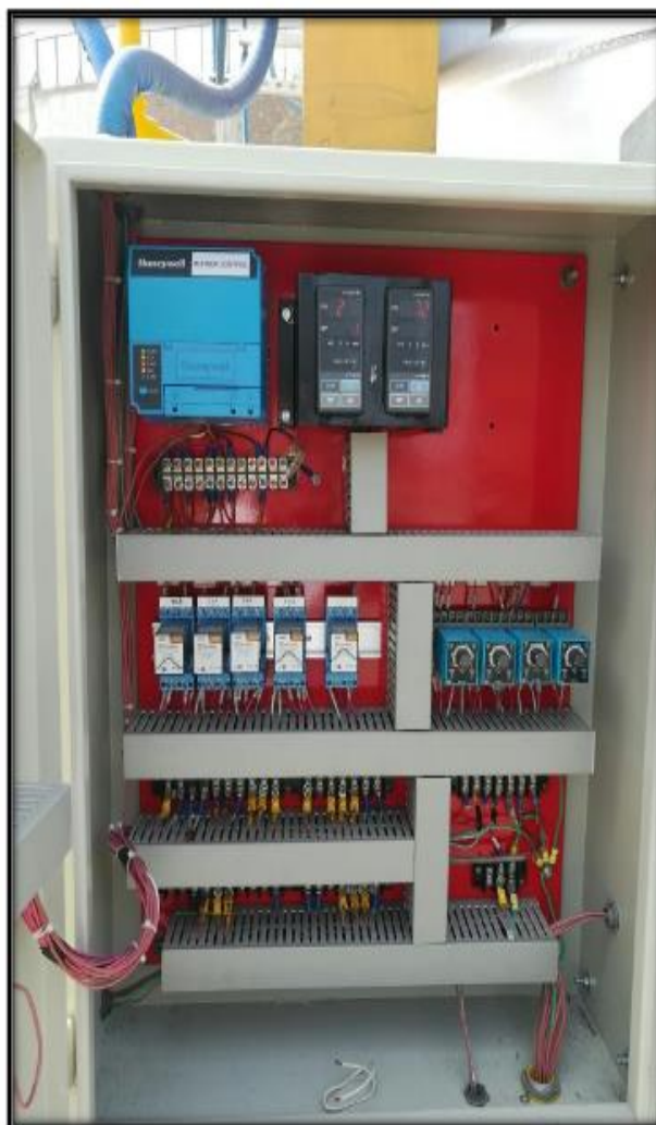
INTERIOR DEL TABLERO DE CONTROL