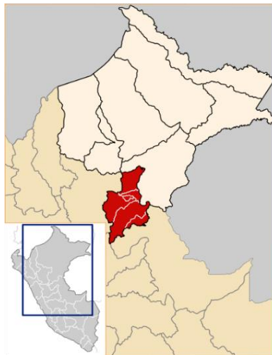
Figura 01: Mapa de la Ubicación de la Provincia de Ucayali