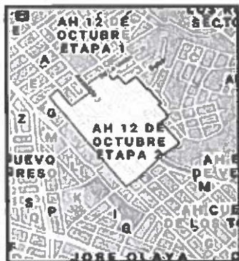
Figura n° 1: Límites del A.H. 12 de Octubre Segunda Etapa.

El terreno donde se desarrollará el Expediente Técnico está ubicado en el A.H. 12 De Octubre Segunda Etapa del Distrito de Ventanilla - Provincia Constitucional del Callao.